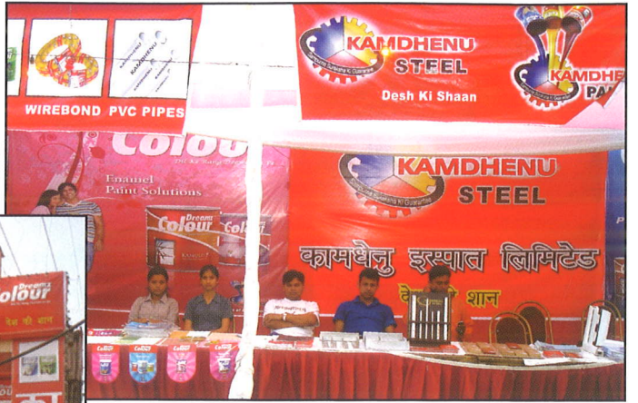
महोत्सव में लगाए गए कामधेनु के स्टॉल एवं तोरण द्वार का दृश्य