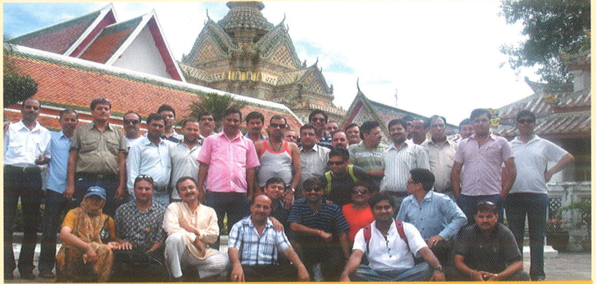
थाईलैंड टूर पर गये कामधेनु के डीलरों एवं डिस्ट्रीब्यूटर्स की विशेष टीम मौज मस्ती में झूमते हुए

भरती सागर की लहरों का आनंद लेते हुए सबने बोट के अंदर ही डिनर का आनंद लिया। अगले दिन का कार्यक्रम शहर की आलीशान खूबसूरती को देखने का था। सिडनी शहर के दिलचस्प नजारों को देखते हुए यह टीम डार्लिंग हार्बर पहुँची। साथ ही सबने ओपेरा हाउस, हार्बर ब्रिज, द रॉक्स एवं बॉन्दाई बीच का नजारा भी किया। तीसरे दिन यह टीम ब्रिस्बेन शहर की ओर